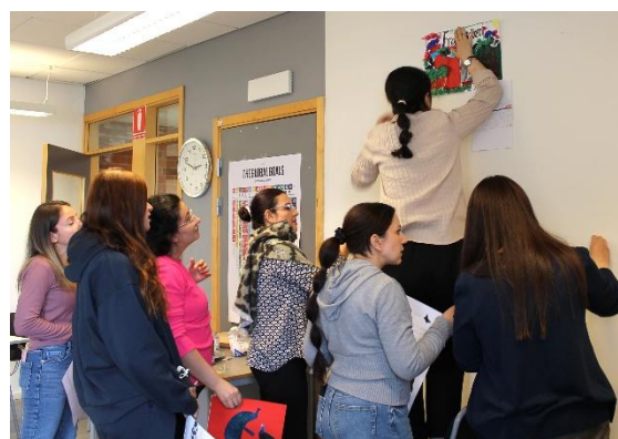
Redovisning av grupparbete

På Röda Korsets folkhögskola fanns vid slutet av året tio olika kurser. Fem av kurserna fanns på allmän kurs på gymnasienivå. Under beteckningen särskild kurs fanns fem kurser, två på heltid på plats i skolan, en helårskurs på distans samt två kurser på deltid på distans under en termin. En av de särskilda kurserna var på grundläggande nivå med fokus på framtida studier och eller arbete för i huvudsak kortutbildade utrikes födda personer.