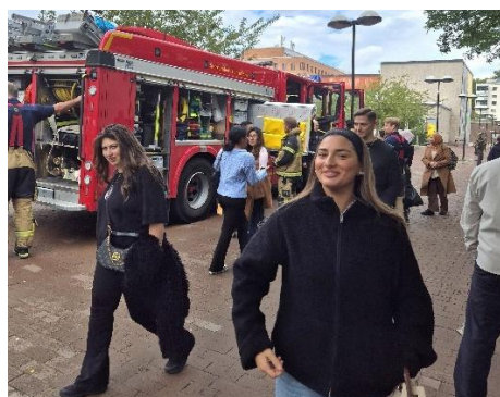
Blåljusdagen utanför Röda Korsets folkhögskola i Skärholmen

Under våren arrangerades en stor temadag om blåljusyrken då vi bjöd in representanter för att sprida kunskap om vad respektive yrke innebär samt olika studievägar för att nå dit. Vi bjöd in två andra folkhögskolor till evenemanget. SVT bevakade detta och det blev ett inslag i SVTs lokalnyheter. Dagen blev så framgångsrik att vi upprepade evenemanget under hösten. Då genomfördes delar av dagen utomhus för att möjliggöra fler besökare. Vi bjöd även in lokala aktörer samt skolor i närområdet.