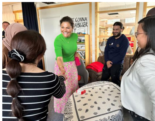
Kronprinsessan Viktoria besökte folkhögskolan 13 maj 2025.