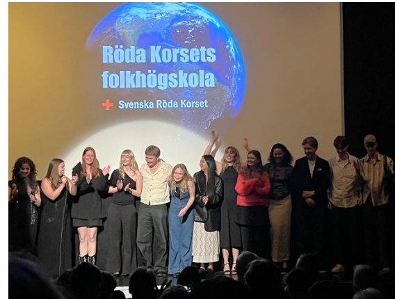
Deltagarna på kursen Dokumentär i Världen på biografen ZITA

utbildningen. Dokumentär i världen hade som brukligt flera före detta deltagare på besök som delade med sig av sina erfarenheter. Kursen reser till Sicilien under februari där de filmar om lokala företeelser.