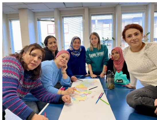
Deltagare på kursen Fokus framtid

Under hösten deltog kursen i ett samarbete med Socialtjänstens föräldrarådgivare som höll utbildningen "Föräldraskap i Sverige" vid fem tillfällen tillsammans med klassens lärare.