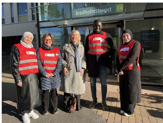
Några deltagare från Volontärgruppen tillsammans med Röda Korsets generalsekreterare.

Under hösten 2023 startade vi en Volontärgrupp på skolan. Inledningsvis var det en integrerad del av två olika kurser. Från och med hösten 2025 har vi flyttat in verksamheten i skolans lokaler. Det har gett ett mervärde då den är mer synlig för hela skolan. Från och med hösten 2025 har det varit ett frivilligt tillval och inte en obligatorisk del av en kurs. Det har ökat motivationen bland deltagarna och är ett populärt tillval.