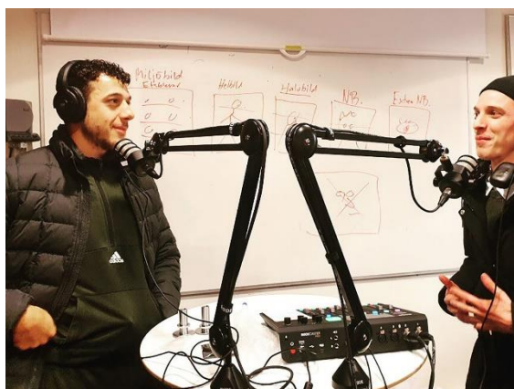
Två deltagare i Sikta mot Högskolan som arbetade med podd under förra läsåret.

I Röda Korskunskap ingår teoretiska studier men även praktiska moment. Under detta läsår fick kursen digital utbildning i Första hjälpen. Efter att alla hade gått en digital kurs fick vi även gå en digital kurs i att bli övningsledare. Rollen som övningsledare efter avslutad kurs var frivillig och innebär att övningsledaren leder första hjälpen för alla som vill öva på första hjälpen efter avklarad utbildning. Vår skola har valts ut som övningshubb för människor som bor i Stockholm och behöver öva.