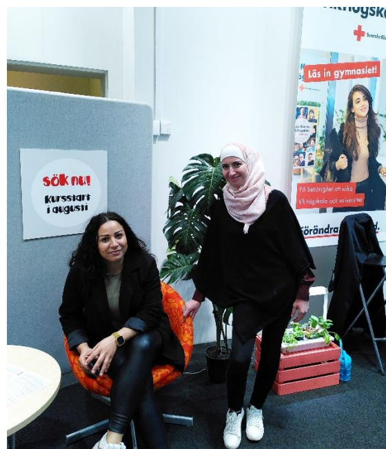
Deltagare i skolans "pop-up" våren 2022

På Röda Korsets folkhögskola fanns vid slutet av året elva olika kurser. Sex av kurserna fanns på allmän kurs och motsvarade olika nivåer på grund- och gymnasieskolan. En av de allmänna kurserna är en distanskurs som startade under hösten 2020. Under beteckningen särskild kurs fanns fyra kurser, tre helårskurser varav en på distans samt en kurs på deltid/distans. Utöver detta hade vi en kurs i svenska från dag ett.