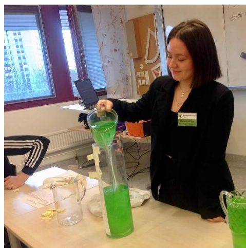
Deltagare på klimatkursen håller workshop på Åva gymnasium

olika omställningsaktörer på olika nivåer i samhället är viktiga redskap för motivation och inspiration. Exempel på ämnesområden som behandlas är global hälsa kopplat till klimatförändringar samt konsekvenser för den mentala hälsan, kommuners hållbarhetsarbete, vetenskapliga framtidsscenarier, naturens rättigheter. Den mer praktiskt inriktade delen i kursen jobbar exempelvis med stadsodling, kompost, jordförbättring, aktiviteter i naturen för att etablera en relation till naturen och klimatsmart matlagning. I kursen ingår även en längre praktik hos en relevant aktör. Under hösten har kursen gjort en utställning om klimatrelaterad migration i samarbete med kursen Migration och social hållbarhet.