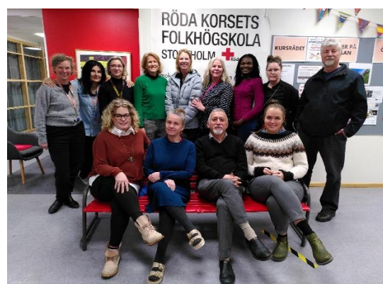
Delar av skolans personal i november 2021

Under hösten har vi även lagt grunden för ett utvecklingsarbete som går av stapeln under 2022 som handlar om kollegialt lärande där lärarna ska "fånga folkbildningen" genom att auskultera hos varandra samt dokumentera varandras iakttagelser samt egna lyckade undervisningsexempel. Motsvarande arbete planeras att genomföras med kursdeltagare.