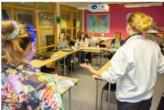
Deltagare på Klimatkursen

Kurserna samverkar kring frågor som rör global utveckling och mänskliga rättigheter och även kring temat ”Makt och media” samt kring reportage och mediateknik. Under våren genomförde kursdeltagarna informationsinsatser enligt särskild redovisning i verksamhetsberättelsen.