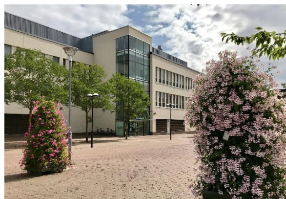
Röda Korsets folkhögskola i Skärholmen

På Röda Korsets folkhögskola pågick vid slutet av 2021 tolv olika kurser. Sju av dessa var på allmän kurs och motsvarade olika nivåer på grund- och gymnasieskola. En av de allmänna kurserna är en distanskurs som startade under hösten 2020. Under beteckningen särskild kurs genomfördes fem kurser, fyra helårskurser varav en på distans samt en kurs på deltid/distans.