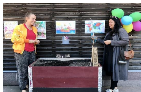
Skördefest i stadsodlingen i september 2021

Arbetet med stadsodlingen kom igång ordentligt under 2020 och 2021. Kursdeltagarna i kursen Klimatomställning i teori och praktik lär sig olika processer i odling, som tex jordförbättring och bokashi. De planerar även för att utveckla platsen till en mötesplats för boende och verksamma i Skärholmen. Centrumledningen har installerat ett vattenutkast i anslutning till stadsodlingen och vi har haft god hjälp av Fryshuset vars sommarjobbande ungdomar har hjälpt till med vattning under sommaren samt konstnärlig utsmyckning av pallkragarna.