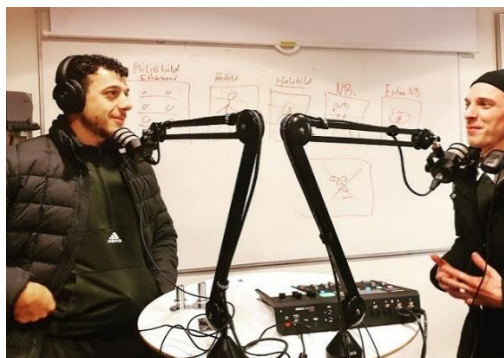
Deltagare från kursen Sikta mot högskolan i poddstudion

På allmän kurs avbröt 7 (10) deltagare sina studier under våren och 17 (19) avbröt sina studier under hösten. På särskild kurs avbröt 12 deltagare sina studier under våren och 14 på hösten. På de särskilda kurserna är det främst från distanskurserna som avhopp sker. Anledningen till avhoppet varierar kraftigt och handlar om bl.a. graviditet, arbete, flytt eller personliga skäl. Flertalet avhopp på distanskurserna på särskild kurs sker i samband med första närträffen. En annan orsak kan vara att deltagare hade uppnått maximalt antal studieveckor hos Centrala Studiestödsnämnden, CSN, och därmed inte kan finansiera sina studier.