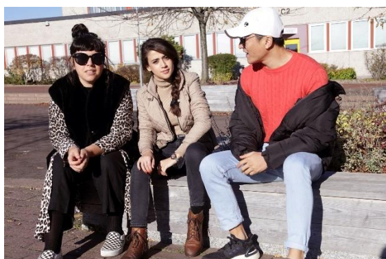
Tre deltagare på kursen Sikta mot högskolan

Kursdeltagarna utbildades av Svenska Röda Korset i att bli övningsledare i Första hjälpen för personer som har gått en digital utbildningen i Första hjälpen online men som vill träna sig på vissa praktiska moment i en liten grupp för att undvika smittrisk.