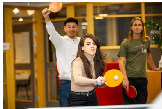
Pingisbordet används flitigt på rasterna

Deltagarnas nyfikenhet och kreativitet har en stor roll i undervisningen. Diskussioner om etiska frågor och ställningstaganden utifrån en naturvetenskaplig utgångspunkt är en viktig del. Undervisningen syftar till att utveckla deltagarnas förståelse för teorier och modellers utveckling, begränsningar och användningsområden. Målet är att utveckla deltagarnas förmåga att arbeta både teoretiskt och experimentellt samt att kommunicera med hjälp av ett naturvetenskapligt språk. De analyserar och löser problem genom resonemang baserade på begrepp och modeller, såväl med som utan matematik och får möjlighet att argumentera kring och presentera analyser och slutsatser.